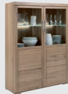
Highboard 2-trg., 118/167/40 cm