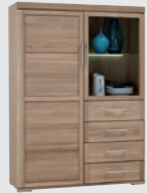
Highboard 2-trg., 4 Schubkästen, 118/167/40 cm