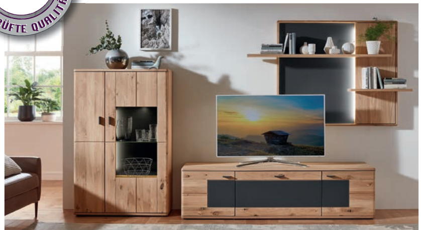
Wohnkombination best. aus.: Highboard mit 1 Glastür und 1 Holztür, TV-Unterteil mit 2 Holztüren und 1 Schubkasten, Wandregal mit Panel und 2 Holzböden. B/H/T ca. 320/195/50,2 cm.