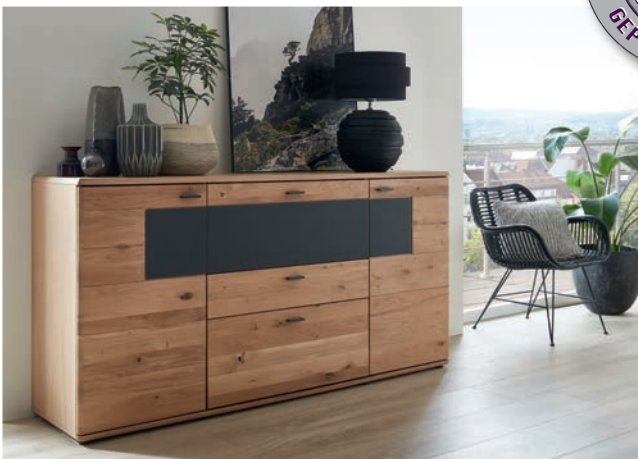
Sideboard mit 2 Holztüren und 3 Schubkästen. B/H/T ca. 180,2/90,1/43,8 cm.